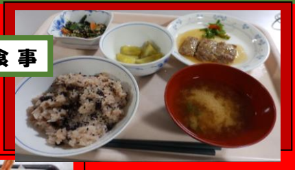
餅つき あんころ餅