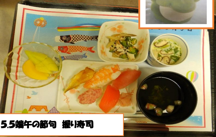
5.5端午の節句 握り寿司