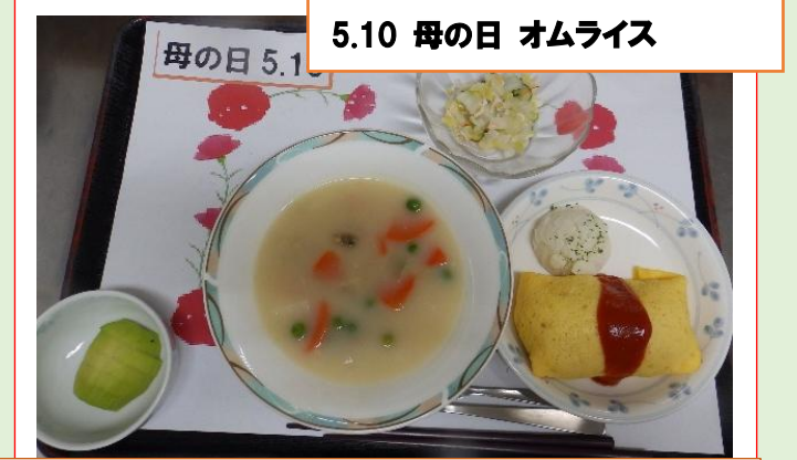
5.10 母の日 オムライス

高齢者のおやつは健康維持に大切 1回の食事量が少なくなる傾向にある高齢者にとっておやつも大切な食事の一部です、エネルギー補給、水分補給、コミュニケーションのとれる機会になり、リラックス効果もあると言われています。食べることは、生きていく上に欠かせないものです。特におやつは生活の潤滑油のような役割もあります。適切におやつを食べて栄養バランスを整えて効果も期待できます。