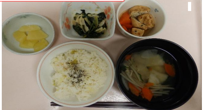
4.29昭和の日 すいとん風