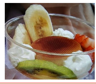
フリンアラモード