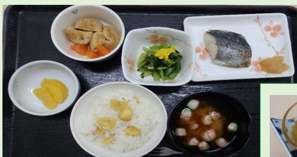
9月9日 季節味 重陽の節句 栗ご飯

9月9日は五節句の1つである「重陽の節句」です。「菊の節句」とも呼ばれ、菊酒を飲んだり、栗ご飯を食べたりして無病息災や長寿を願います。最近はあまりなじみがない節句ですが、旧暦を使用していた頃までは五節句を締めくくる最後の行事として盛んに行われていました。