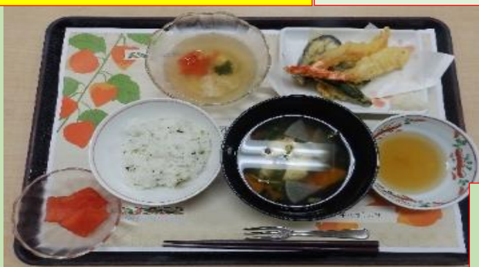
8月16日 行事食 盂蘭盆会 暑気払い 天ぷら ゼリー寄 おはぎ

暑い日が続いています。食事も「猛暑を乗り切る」献立をこの夏はお出しました。各階夏祭りのおやつも楽しんでいただけたようでした。